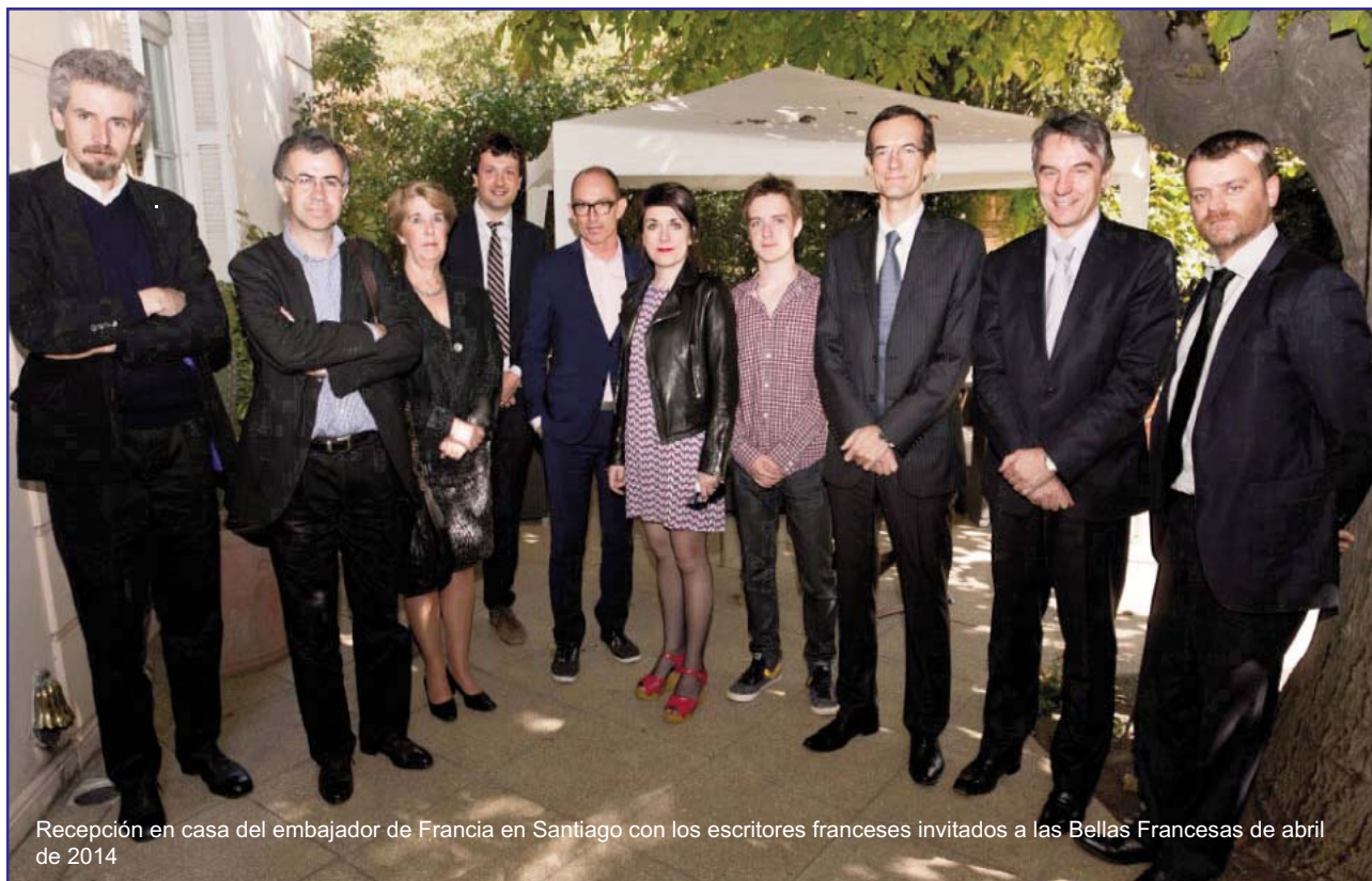
Recepción en casa del embajador de Francia en Santiago con los escritores franceses invitados a las Bellas Francesas de abril de 2014