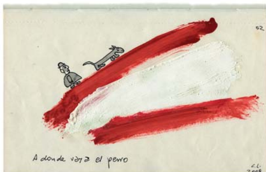
Dessin de Carlos Liscano écrivain uruguayen