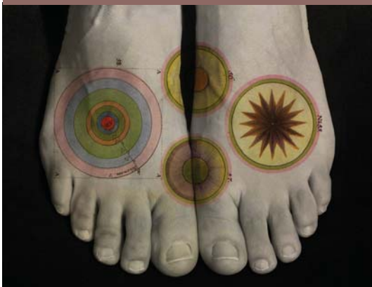
Photo de Tatiana Parco (Mexique) un des photographes de l'exposition Luz Portátil.