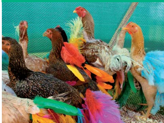
Installation de l’artiste brésilienne Laura Lima invitée à la 11 e biennale de Lyon : 15 septembre - 31 décembre