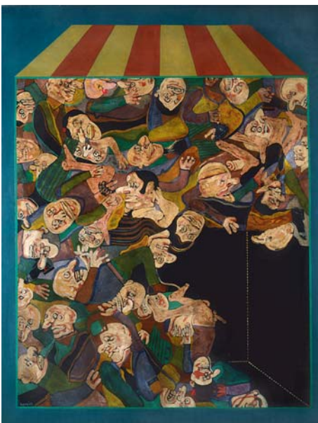
“Caja con señores III”, 1963. Antonio Seguí Huile sur toile 250 x 196 cm, collection particulière, Paris.