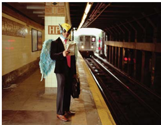
Photo: Dulce Pinzón (Mexique). Rencontres photographiques d'Arles - 2011. Site : www.dulcepinzon.com